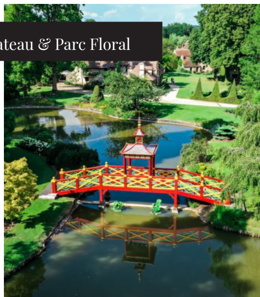
Chateau & Parc Floral

Du 1er avril au 1er octobre, le village d'Apremont-sur-Allier vous dédie ce qu'il a de plus poétique, à savoir son Château et son Parc Floral.