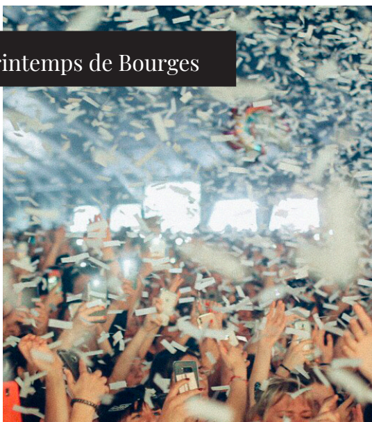
Printemps de Bourges